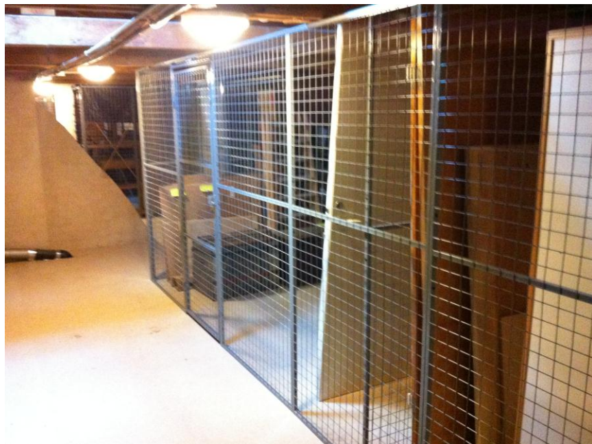
Figur 7. Montering av nya vindsförråd