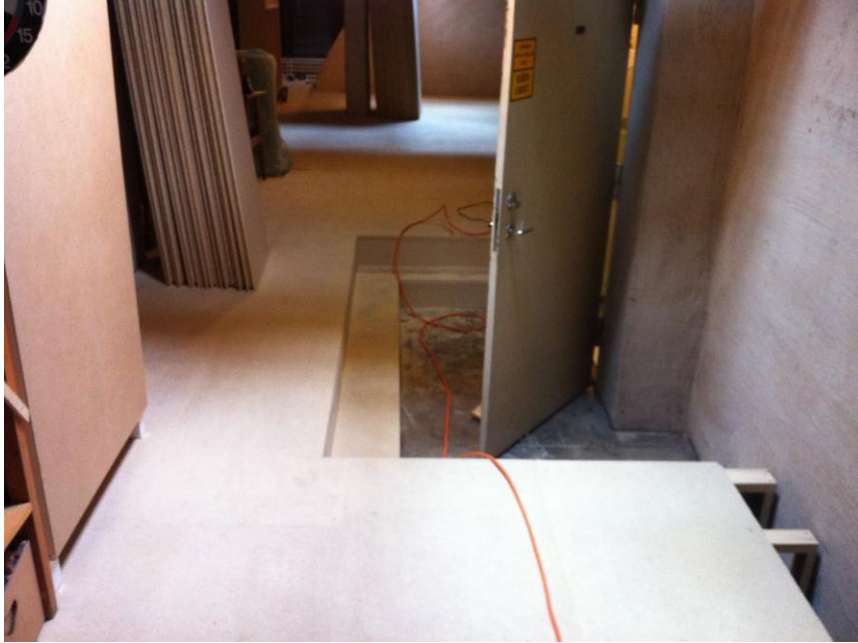
Figur 4. Sarg och insteg till vinden