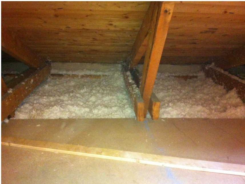
Figur 5. Tilläggsisolering med lösull under och utanför nytt golv