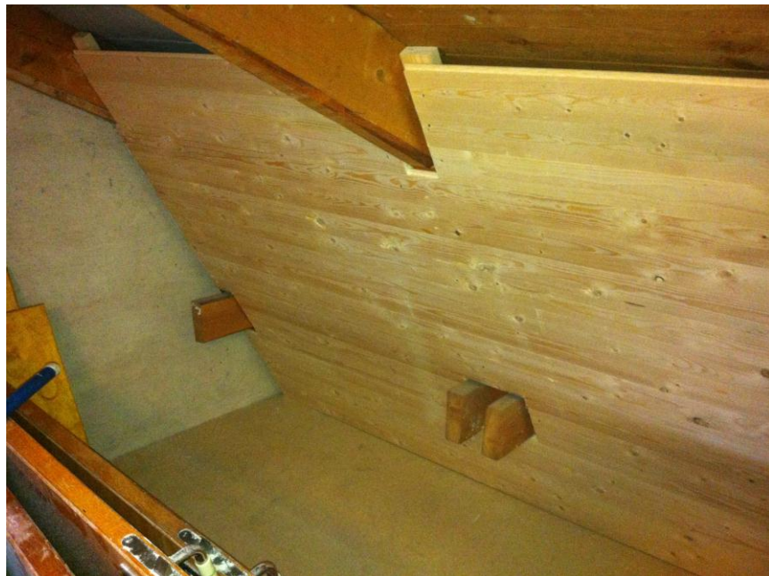
Figur 6. Inklädning av takfot med råspont