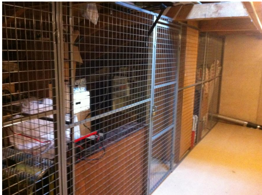
Figur 8. Montering av nya vindsförråd

Vi är certifierade enligt Behörig Lösull och är medlemmar i Lösullsentreprenörerna inom Sveriges byggindustrier.