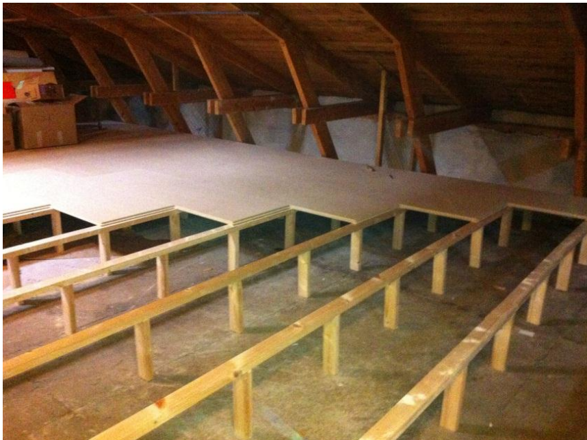
Figur 3. Uppstolpning av golv samt montering av golvspånskiva