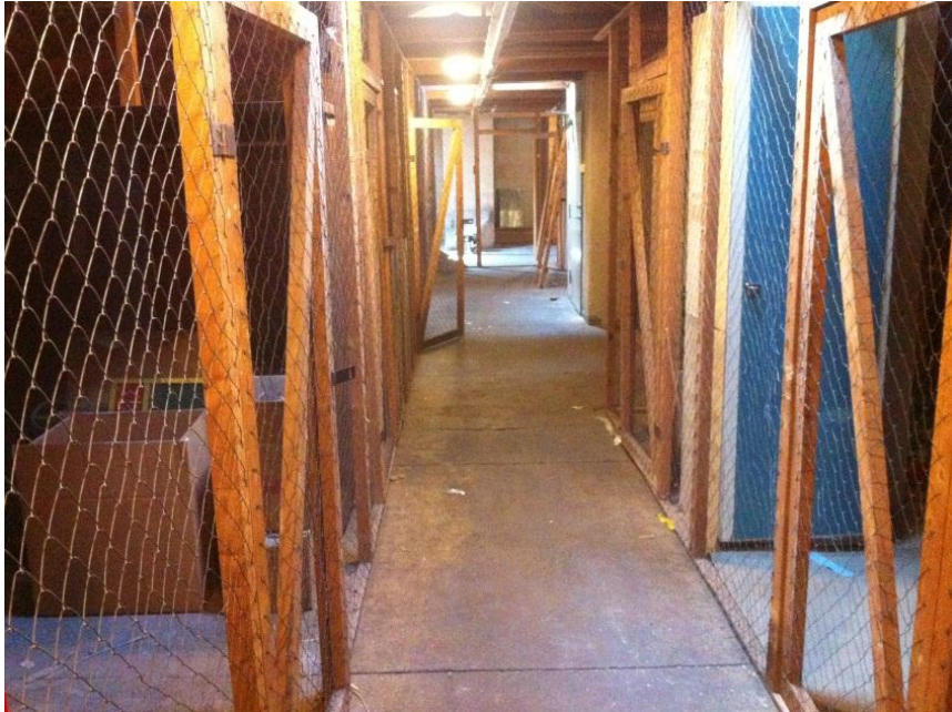
Figur 2. Befintliga förråd som demonteras